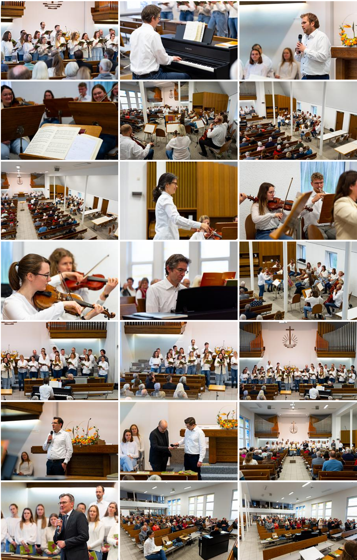
Jugend bewegt! Spontanes Spendenkonzert ein voller Erfolg!